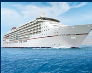
MS EUROPA 2